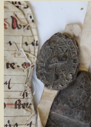
(1) Fragment de Bréviaire fin XIII e découvert aux Archives Départementales de la Vienne (Poitiers) en novembre dernier